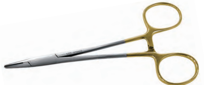
ニードルホルダーメイヨヘーガ TC加工