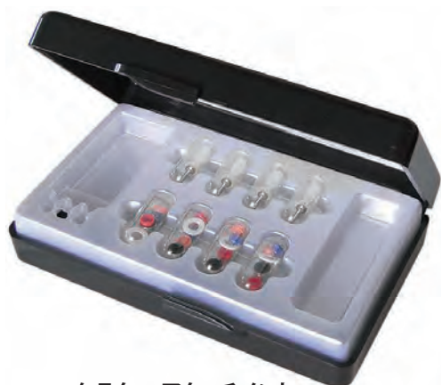
ケラターアタッチメント