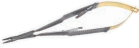
ラッシャル 持針器 PCF-N-TCL/C