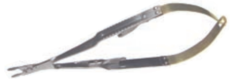
ラッシャル 持針器 CE-2-731-10L

品番 la000028 ¥61,000 15 cm straight Castro Viejo with suture cutter (shown)