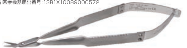
ラッシャル マイクロ シザーズ 51-15-30C

14 cm 'reach anywhere' shaped scissors with 1.25 cm blades