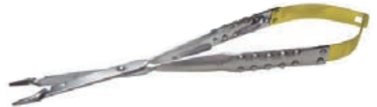
ラッシャル 持針器 CE-2-631-10RL

品番 la000087 ¥68,000 17.5 cm Baraquer needle holder with suture cutter (shown)