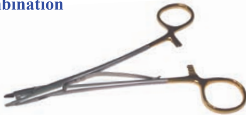
ラッシャル 持針器 2-331-20

品番 la000071 ¥28,000 15.25 cm straight Mayo-Hegar - for suture sizes 0-6/0