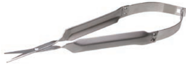
ラッシャル シザーズ MPF-1